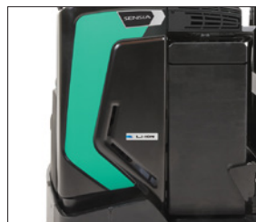
Batería de iones de litio*