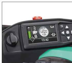
Pantalla multifunción en color

* Consulte disponibilidad en su zona. ** No disponible combinado con cabina para almacenamiento en frío opcional *** No disponible combinado con baterías de iones de litio